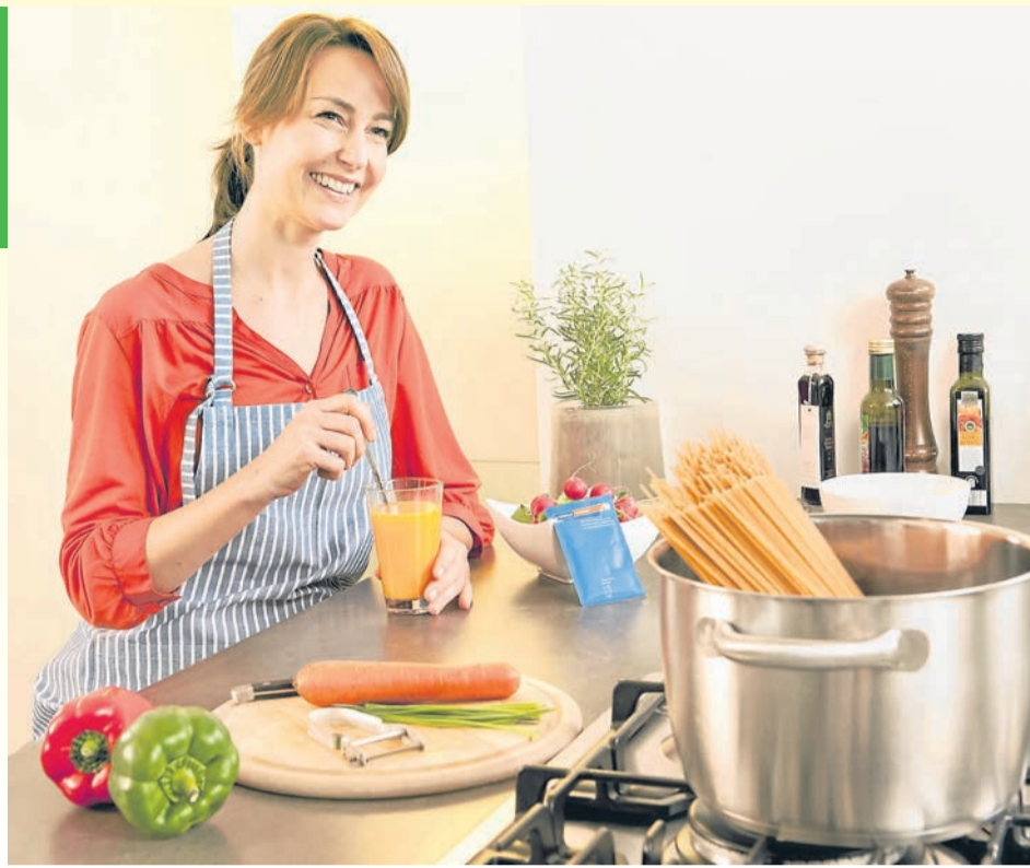
Wohlfühlen und fit bleiben bei Wind und Wetter. Die Ernährung im Herbst sollte anders aussehen und reich an Vitamin C und Zink sein.